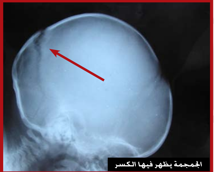
الجمجمة يظهر فيها الكسر