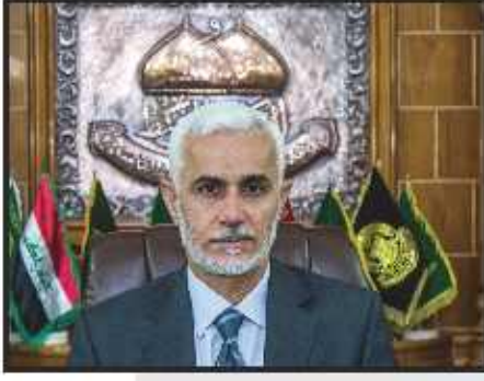
أدحيدر حسن جليل الشمري الأمين العام للعتبة الكاظمية المقدسة