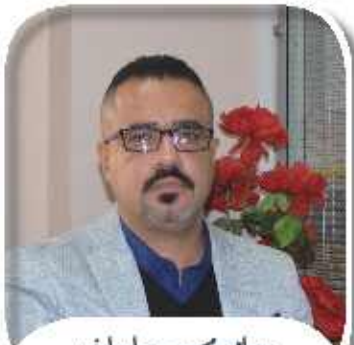
واسم محمد سلمان